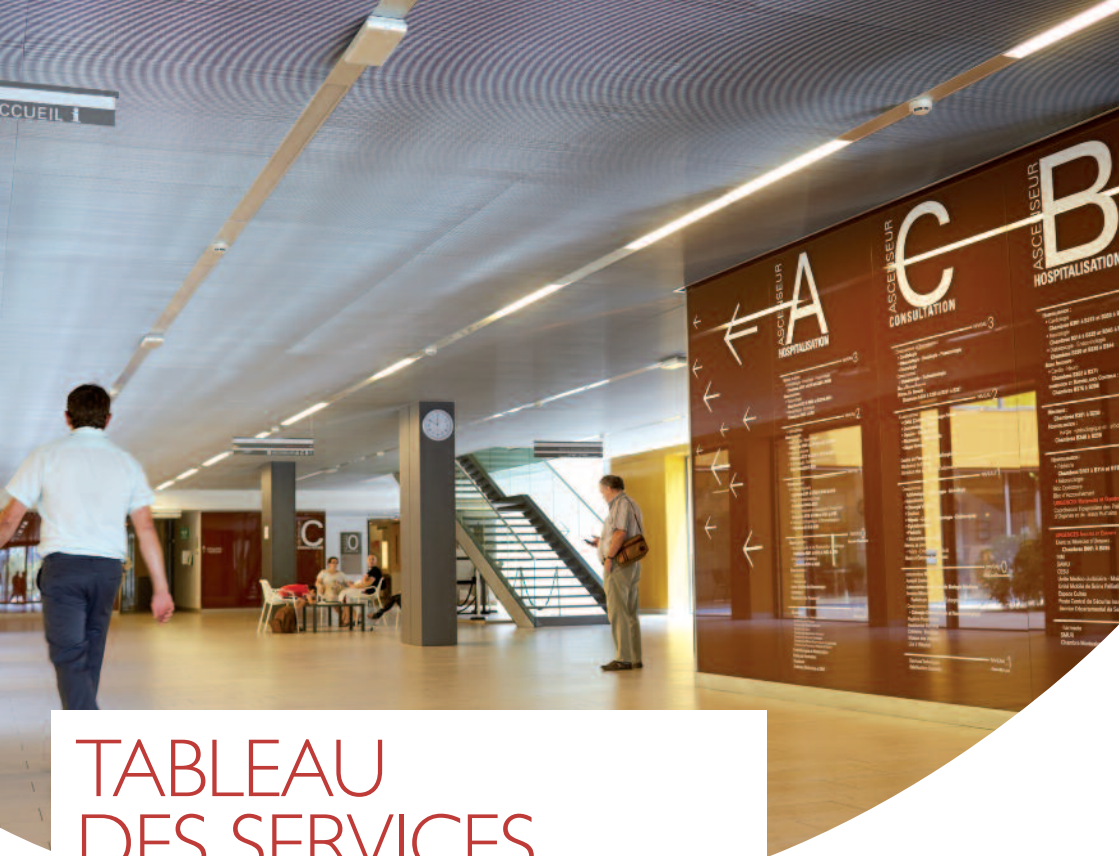
TABLEAU DES SERVICES PAR ORDRE ALPHABÉTIQUE PÔLE / NIVEAU / ASCENSEUR